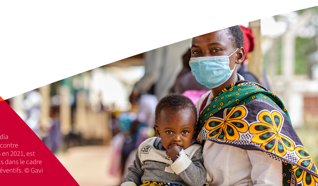
Photo : Grâce à des projets pilotes cofinancés par Unitaid, le Fonds mondial et Gavi, le premier vaccin au monde contre le paludisme, recommandé par l'OMS en 2021, est actuellement administré à des enfants dans le cadre d'un programme complet de soins préventifs.

Nous collaborons avec les communautés pour identifier les nouvelles difficultés et les populations défavorisées. Nous investissons dans des technologies de pointe et des approches innovantes qui renforcent la réponse au paludisme.